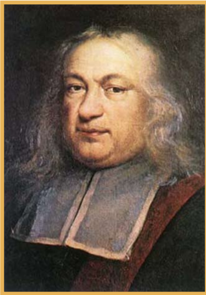
Pierre de Fermat (* Ende 1607 oder Anfang 1608 in Beaumont de Lomagne; † 12. Januar 1665 in Castres) war ein französischer Mathematiker und Jurist sowie (Mit-)entwickler der Wahrscheinlichkeitsrechnung.